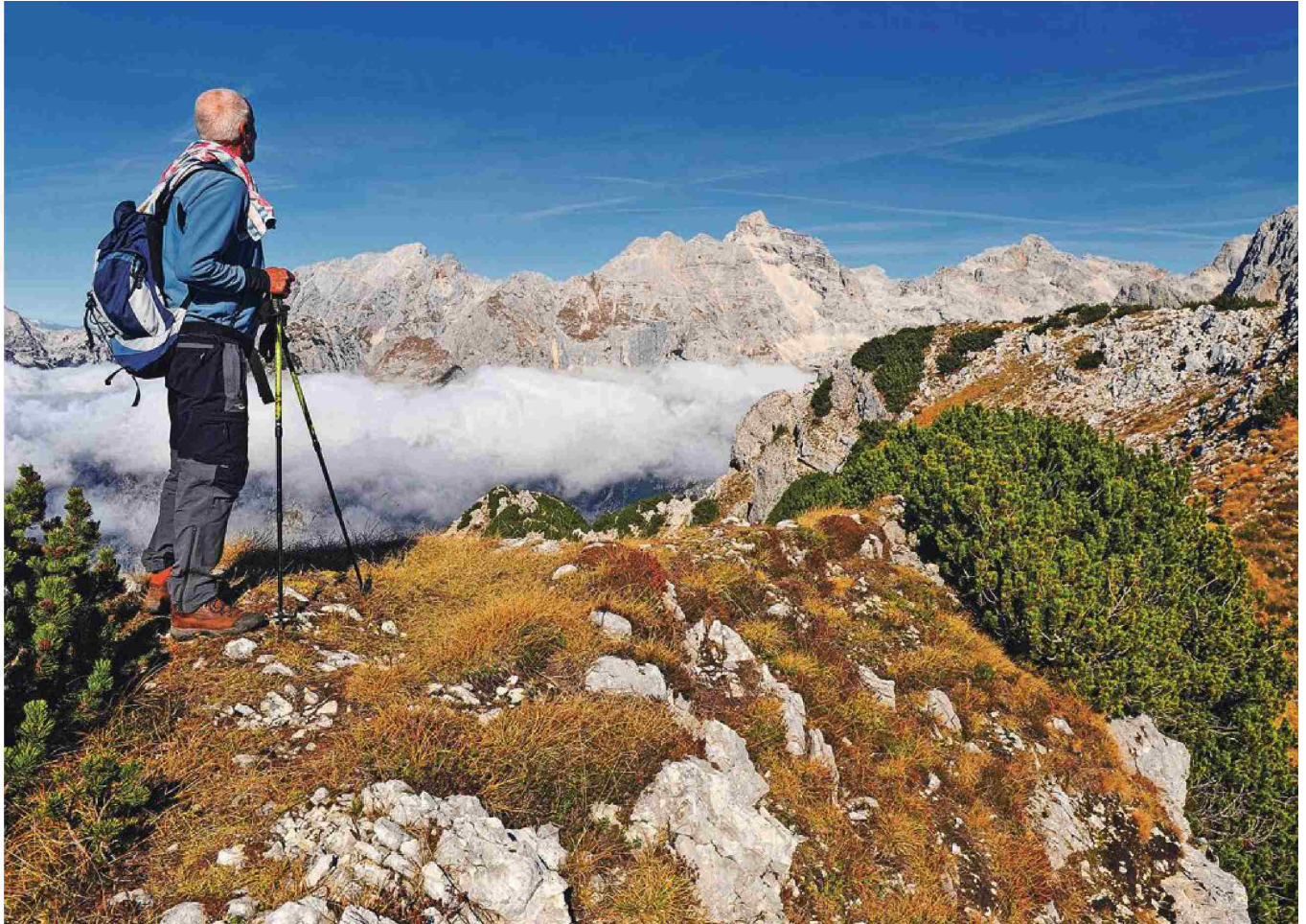
Na Zadnjiškem Ozebniku, v ozadju Razor