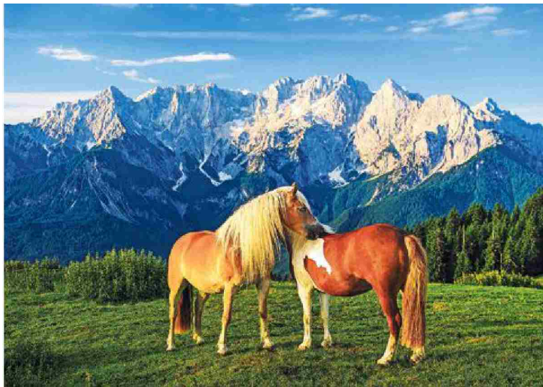
Konja na Vošči