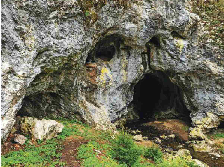
Vhod v jamo Vranja peč s polzelske strani