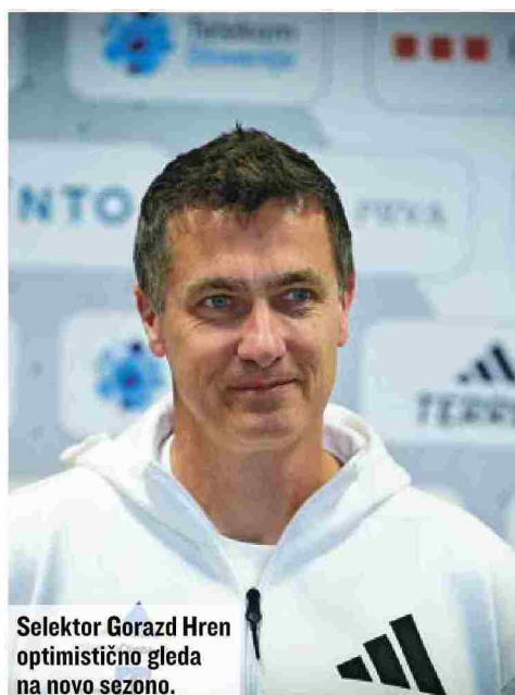
Selektor Gorazd Hren optimistično gleda na novo sezono.